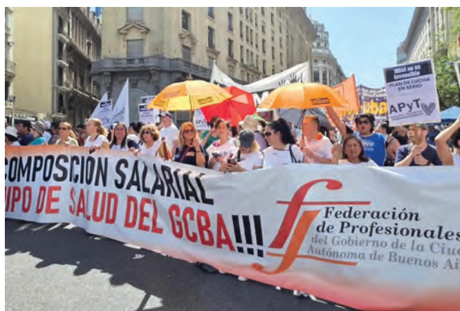
La Federación de Profesionales del GCABA en la movilización a Plaza de Mayo contra la Reforma Laboral, 18/12/2025.