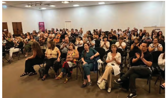
Amplia participación del auditorio en el Congreso General Ordinario de la Federación de Profesionales del GCABA. 27/01/2026.