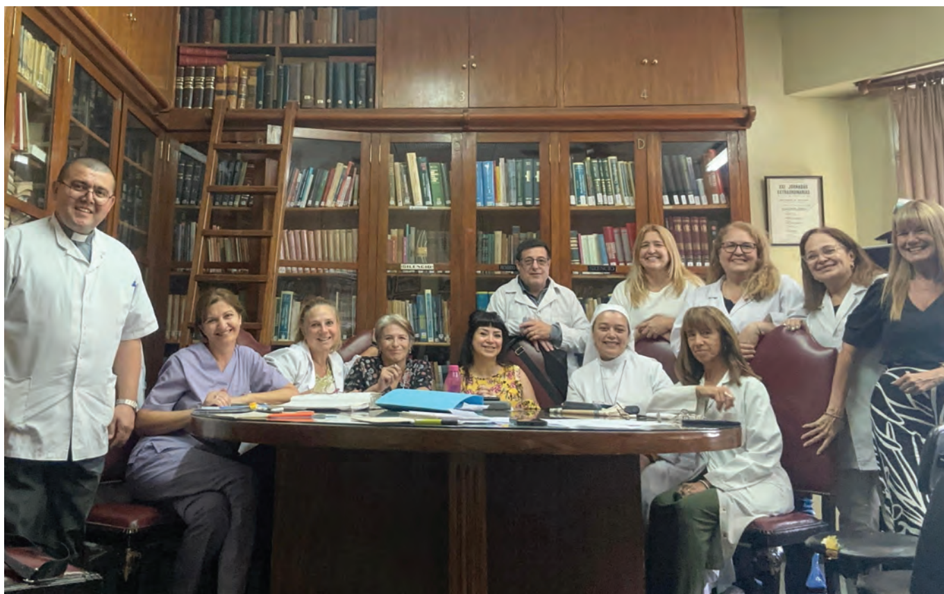
Foto del Comité de Bioética del Hospital General de Agudos Donación Francisco Santojanni.

hospital público constituye un proceso progresivo, que requiere compromiso institucional, trabajo interdisciplinario, sostenido y estrategias de visibilización en el tiempo.