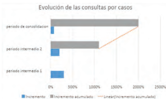
Figura 1. Evolución de las consultas por casos clínicos

En concordancia con estos datos, la evolución temporal de las consultas muestra una tendencia ascendente sostenida, evidenciando un incremento total del 2000%, coherente con el proceso de visibilización e integración progresiva del Comité en la práctica hospitalaria (Figura 1).