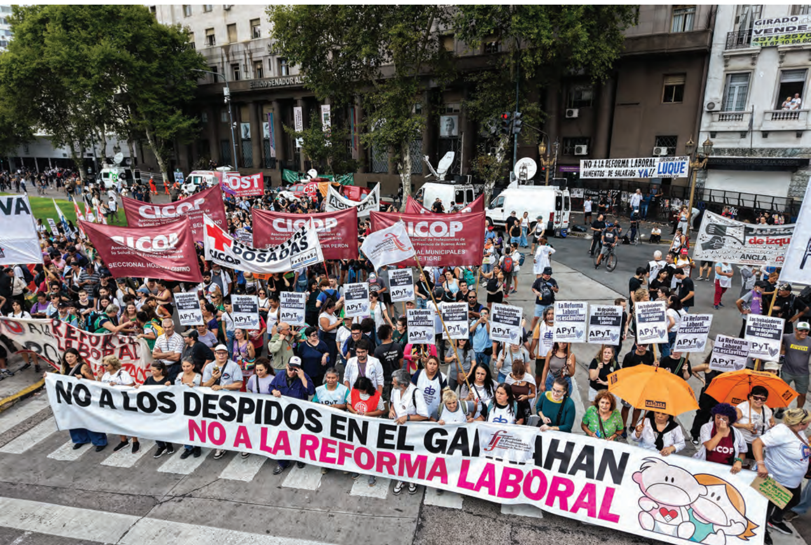
En el marco del Paro convocado por la CGT, la Federación de Profesionales del GCABA junto a otras organizaciones de salud que participan del Cabildo abierto, marchan contra la Reforma laboral y en apoyo a la lucha del Hospital Garrahan, 19/02/2026.