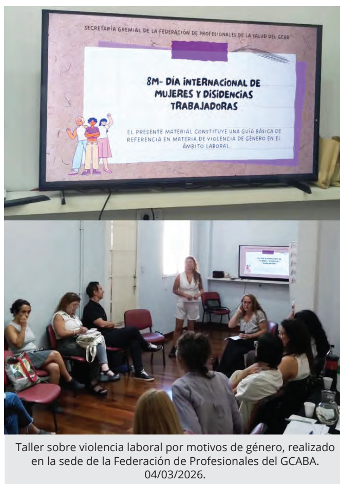
Taller sobre violencia laboral por motivos de género, realizado en la sede de la Federación de Profesionales del GCABA. 04/03/2026.

Asimismo, la Federación participó de la movilización del 8 de marzo, reafirmando el compromiso con la construcción de espacios laborales libres de violencias y con perspectiva de género. Entendemos que visibilizar estas problemáticas y organizarnos colectivamente es fundamental para transformar las condiciones en las que trabajamos y sostenemos la vida cotidiana.