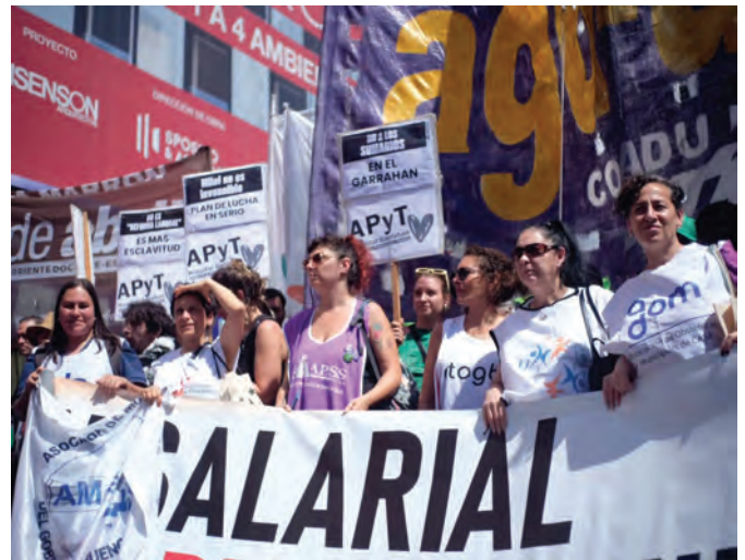
Compañeras de distintas asociaciones (ALE, AMdeBA, APSS, ATOGBA, APACSA, ADOM), llevando la bandera de la Federación de Profesionales del GCABA, en la movilización a Plaza de Mayo contra la Reforma Laboral, 18/12/2025.

dar espacios de organización y participación. En un escenario adverso, sostenemos que la defensa de los derechos laborales y de una salud pública, integral e interdisciplinaria requiere de una construcción colectiva sostenida. La experiencia reciente vuelve a poner en evidencia que es en la organización donde las y los trabajadores encuentran la herramienta más efectiva para poner límites y disputar el sentido de las políticas que afectan sus condiciones de trabajo y de vida.