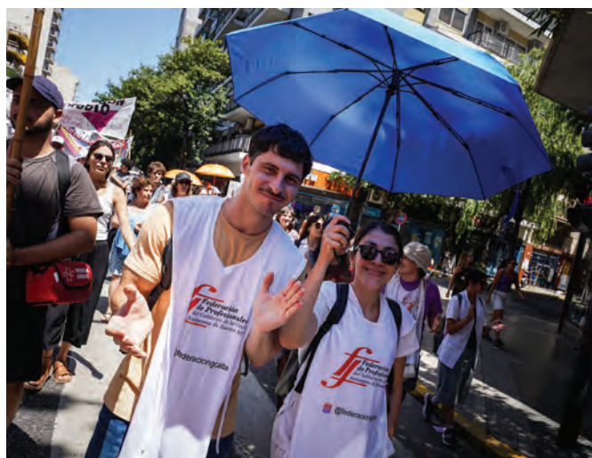
En la foto: compañeros de la Federación de Profesionales del GCABA participando de la Movilización al Congreso Nacional, contra la Reforma laboral 11/02/2026.

En un contexto de ataque a los derechos laborales, el Gobierno Nacional presentó una reforma laboral regresiva que fué tratada e incluso aprobada recientemente en el Congreso.