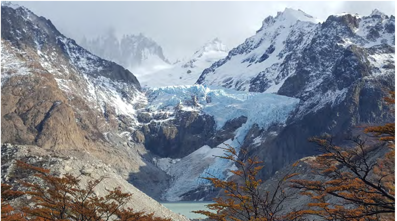
Glaciar Piedras Blancas - Santa Cruz.

Ambientalista, farmacéutica, Ma- gíster en Salud Pública, Especialis- ta en Farmacia Sanitaria y Legal.