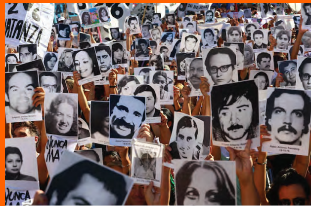
Marcha 24 de Marzo de 2026. Aniversario 50 años del Golpe.

En este contexto, la masividad de la movilización expresa no solo un ejercicio de recuerdo, sino una respuesta colectiva frente a los intentos de retroceso en materia de derechos y a la disputa por el sentido de nuestra historia reciente. La memoria, en este sentido, no es solo pasado: es